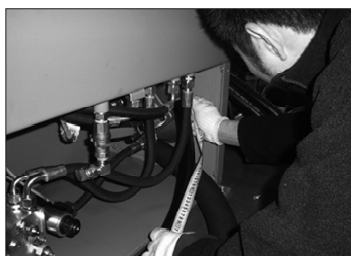
船体に付いたままホースの 規格を点検し長さを計測。