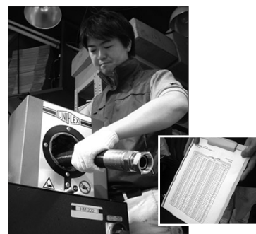
点検後ホースリストを作成し お渡しいたします。 その後ホースを製作いたします。