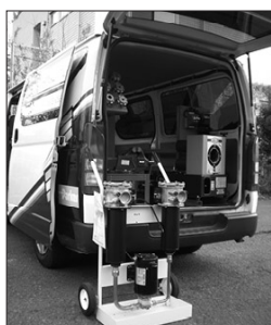
ホースドクターカーで修理 ドッグや埠頭などの現場へ。