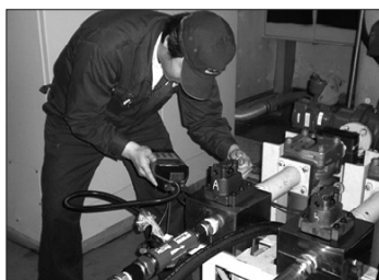
修理中の船内で油圧配管の圧力・流量・ 油温を計測器 Parker システム20で診断。