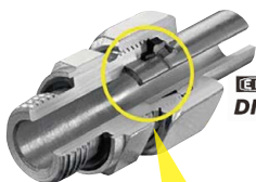
Ermeto Original DIN fittings